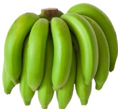
ECCB1 BANANO CAVENDISH